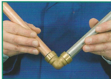
5. Fitting bis zur Markierung auf das Rohr aufschieben.