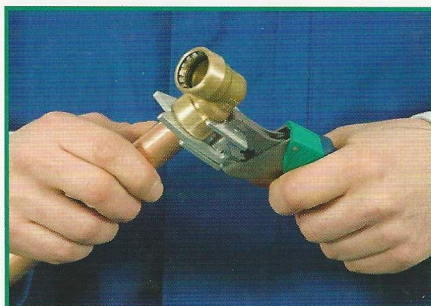
1. Lösewerkzeug mit dem zur Rohrdimension passenden Wechseleinsatz ansetzen und zudrücken.