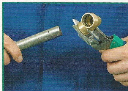
2. Mithilfe des Lösewerkzeugs den Fitting vom Rohr ziehen.