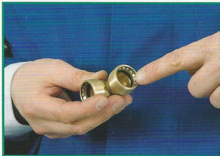
4. Fitting auf Sauberkeit und korrekten Sitz des Dichtelements überprüfen.