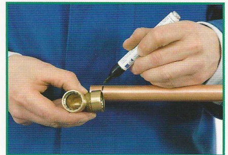
3. Rohr mit der Einstecktiefe des Fittings markieren.